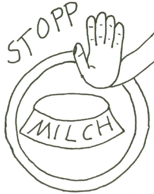
..aber vertragen KEINE Milch!

Im Herbst benötigen Igel ein Mindestgewicht von ca. 700 g, um den Winterschlaf zu überstehen.