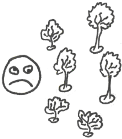
Super aufgeräumte Gärten mögen Igel nicht!